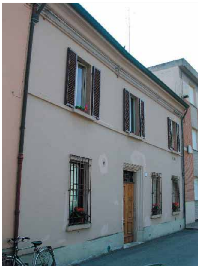
Via Cadorna 7 Fronte Principale